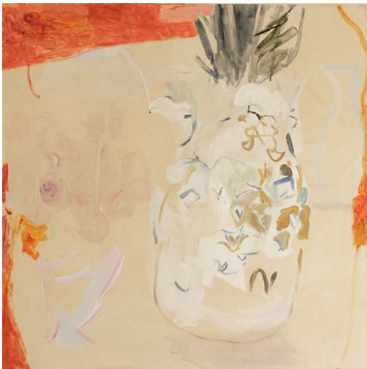
Still life, 2019 Acrylic on canvas 80 x 80 cm