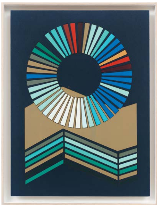
Jenny 5 (Jenny Saville, Entry, Edition of 12) 2018 Laser-cut, plywood, acrylic, glue 42.4 × 32.7 × 3 cm