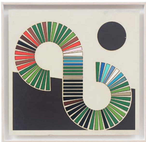
Henri 3 (Henri Matisse, Odalisque au tambourin, Edition of 11), 2018 Laser-cut, plywood, acrylic, glue 32.3 × 33.4 × 3 cm