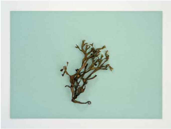
Find, No. 19 ( Fucus vesiculosus ), 2015 Pigment print, framed, museum glass 26 x 34 cm