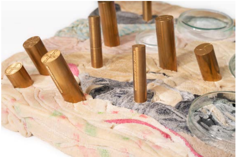
Voodoo V (detail), 2017 Mixed media 32.5 × 24.5 cm