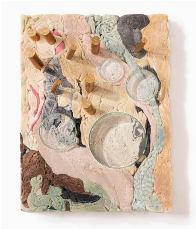
Voodoo V, 2017 Mixed media 32.5 x 24.5 cm