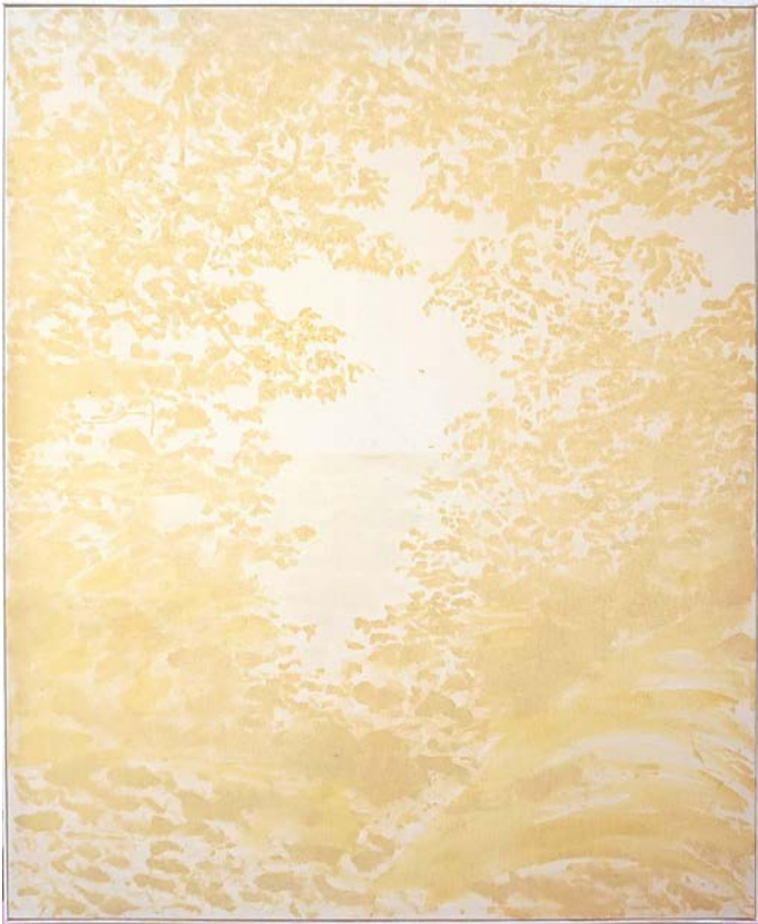
Chicago (Day Trip to Michigan Lake), 2018 Oil and varnish on canvas 165 x 135 cm