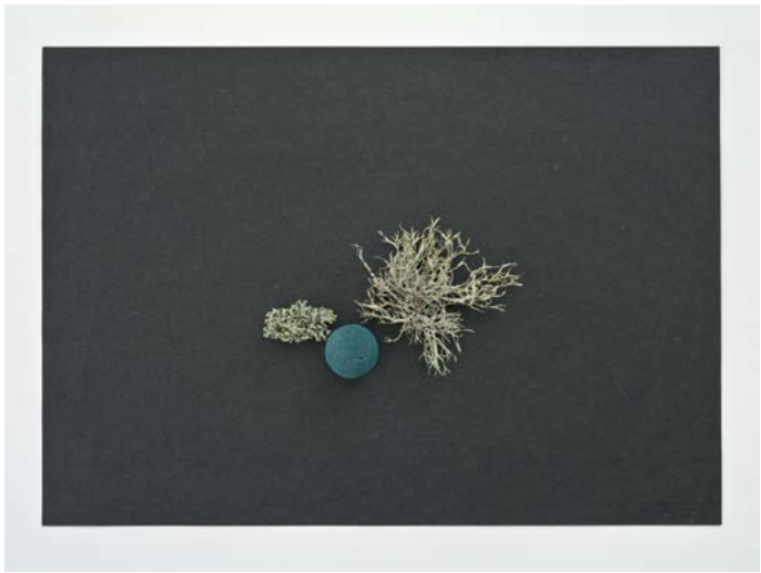
Find, No. 30 ( Ramalina farinacea , Hypogymnia tubulosa , Sponge ball), 2017 Pigment print, framed, museum glass 26 x 34 cm