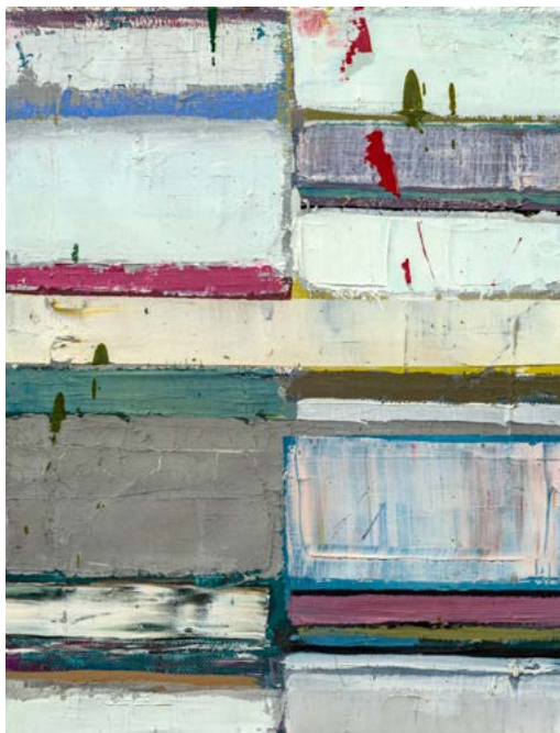
Untitled, 2018 Oil on canvas 40 x 30 cm