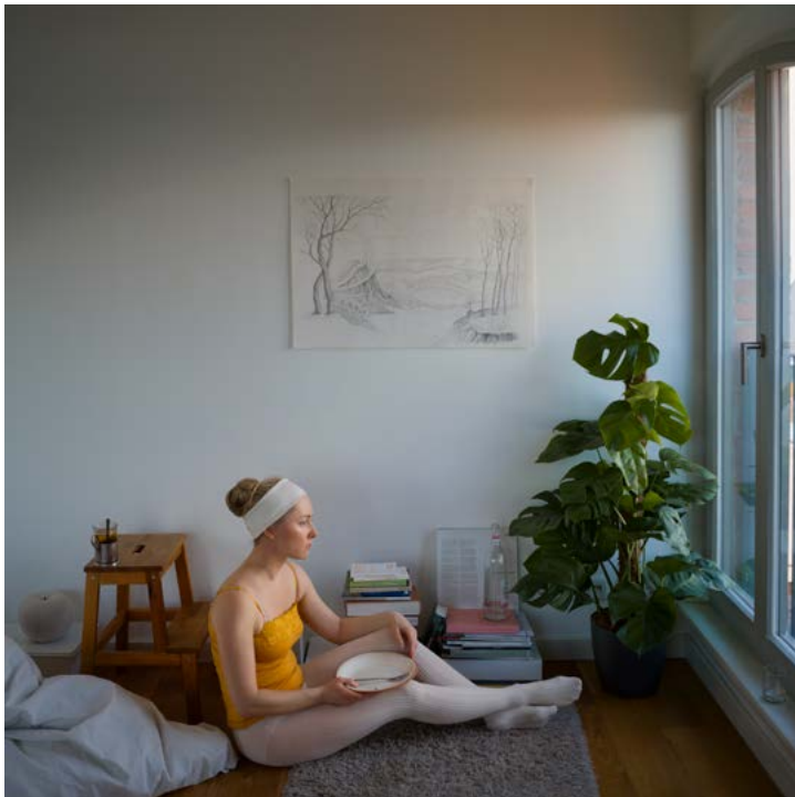
Sunday Morning (from the series Zweiraumwohnung), 2018 Archival pigment print 150 x 150 cm