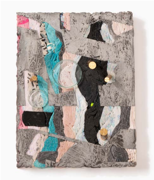
Voodoo I, 2017 Mixed media 32.5 x 24.5 cm