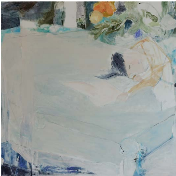
Cloud, 2019 Acrylic on canvas 80 x 80 cm