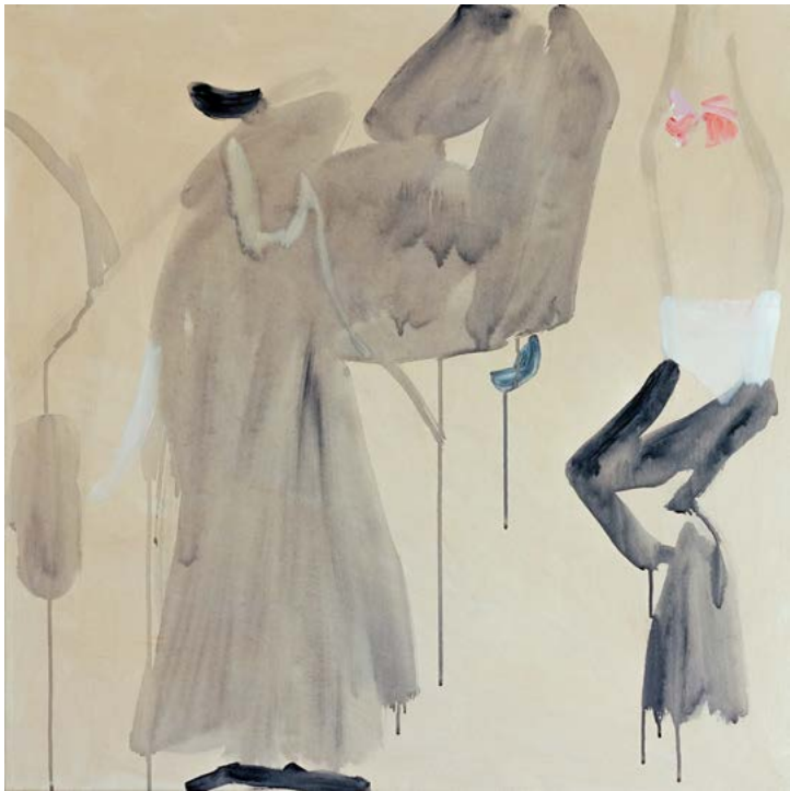
Bar, 2019 Acrylic on canvas 80 x 80 cm