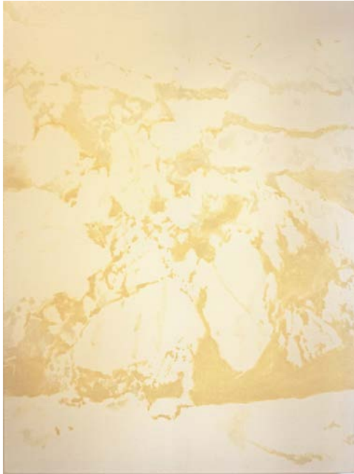
Untitled (Svalbard 2), 2019 Oil on canvas 135 x 100 cm