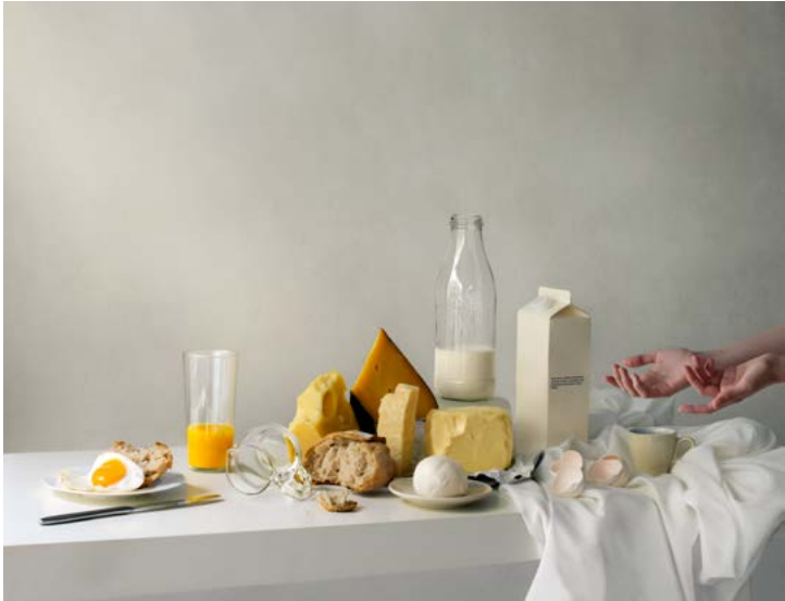
Early Breakfast (from the series Repast), 2015 Archival pigment print 38 x 50 cm