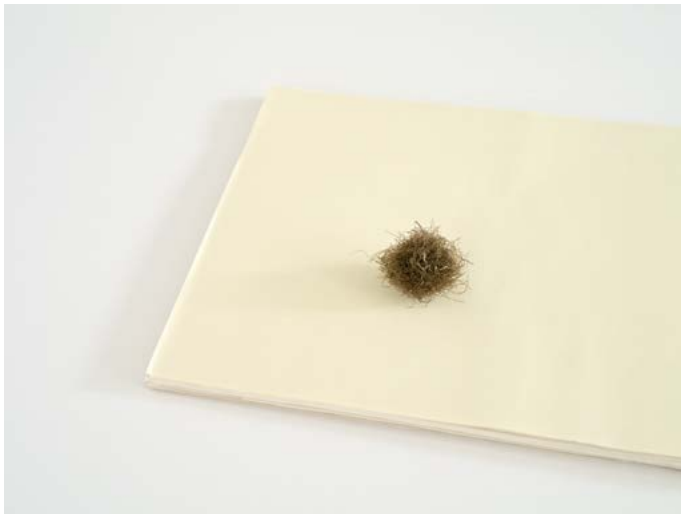
Find, No. 8 (Sea ball), 2015 Pigment print, framed, museum glass 26 x 34 cm