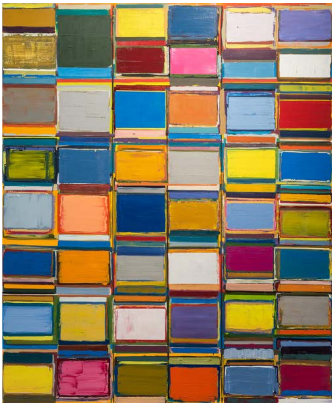
Anbasha, 2017/18 Oil on canvas 200 x 165 cm