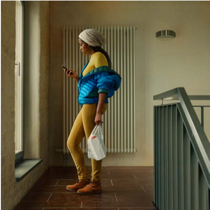
Besrat – Good News (from the series Zweiraumwohnung), 2017 Archival pigment print 100 x 100 cm