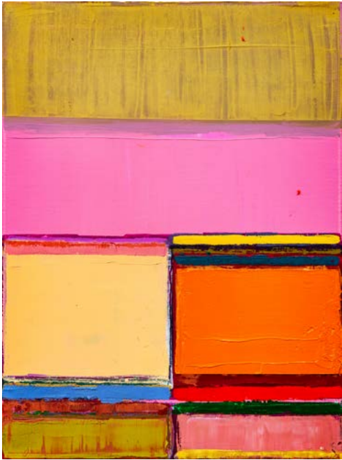
Untitled, 2019 Oil on canvas 40 x 30 cm